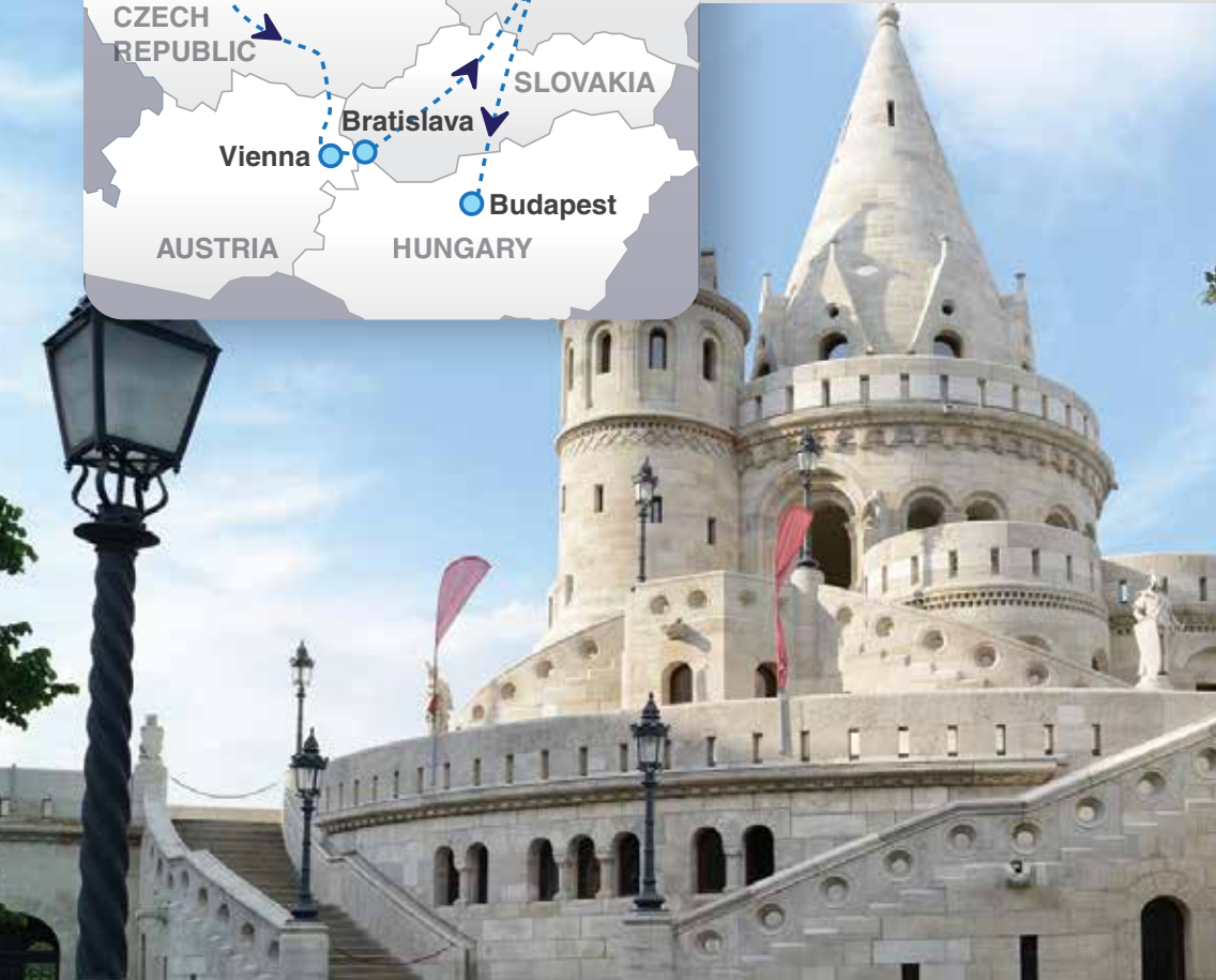
Fisherman Bastion, Budapest