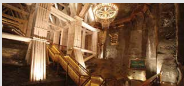
维利奇卡盐矿， 克拉科夫