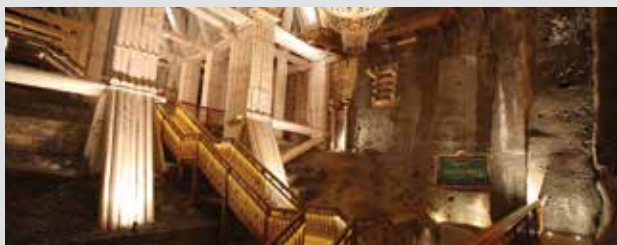
Wieliczka Salt Mine, Krakow